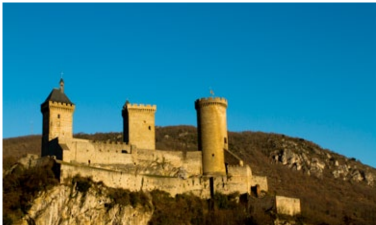
Vue du château