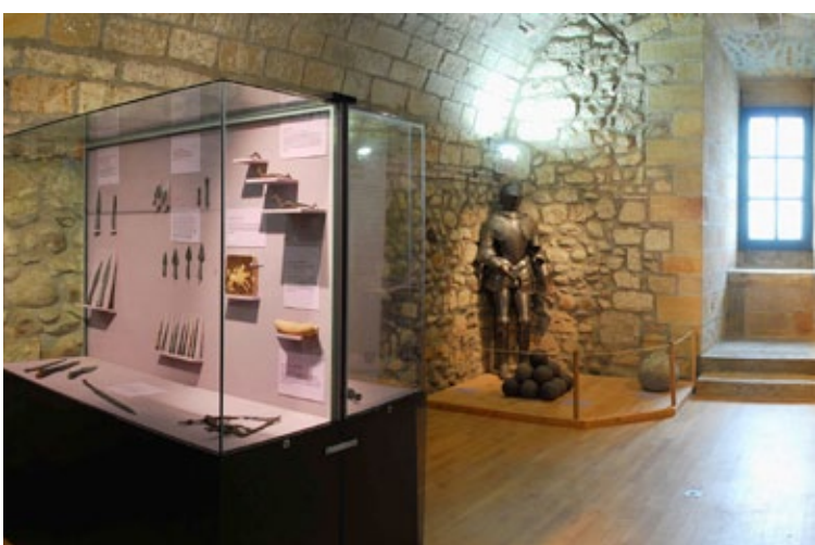
La salle des armes