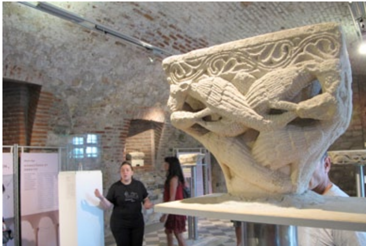
« Entre ville et château, l'Abbaye Saint-Volusien »