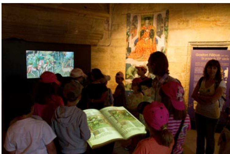
« Gaston Fébus, prince éclairé des Pyrénées »