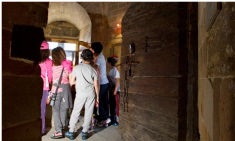
« Dans le secret des bâtisseurs médiévaux »