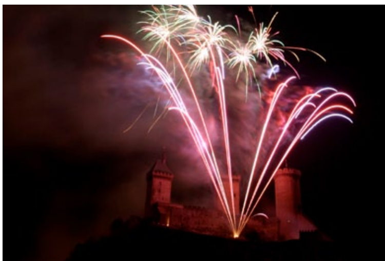
Feu d'artifice au château