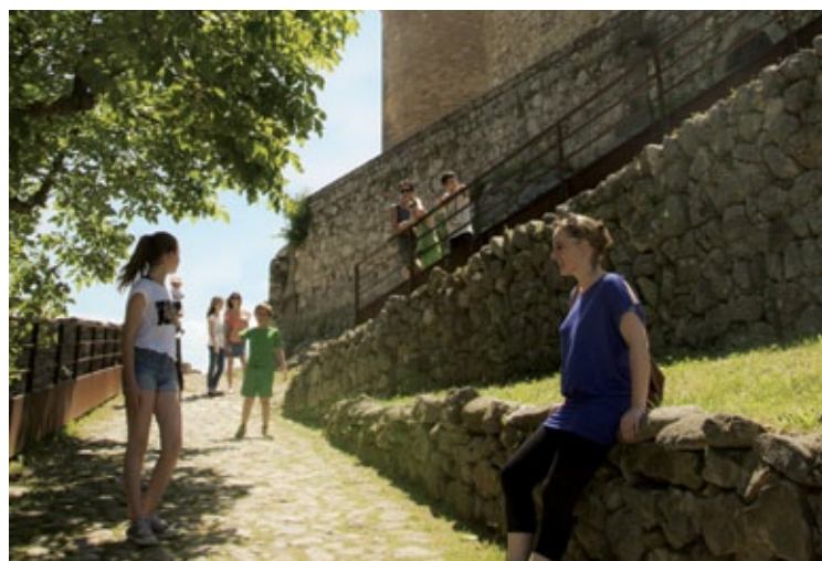
La « calade »