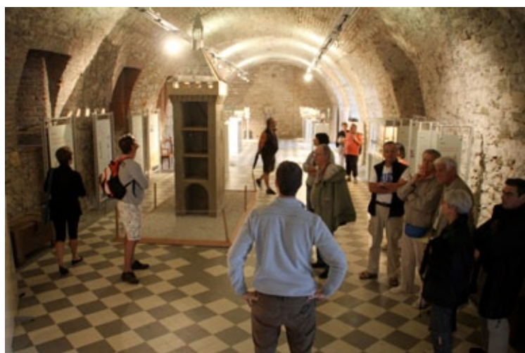
La salle des gardes