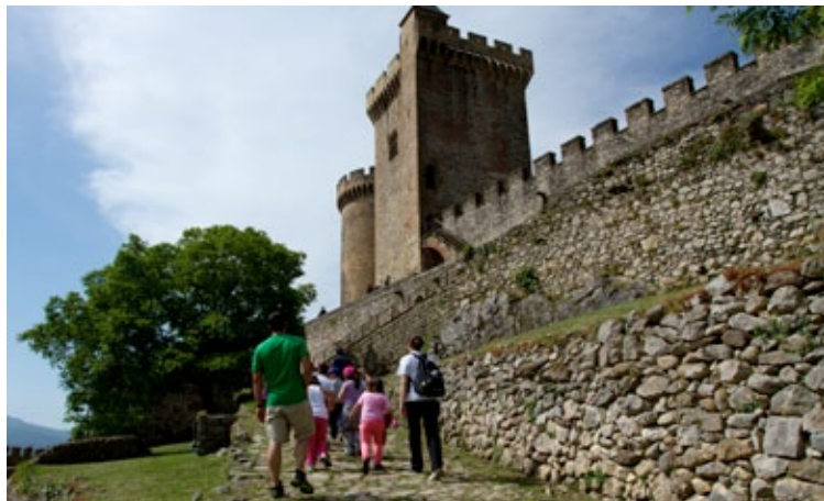
La montée de la « calade »