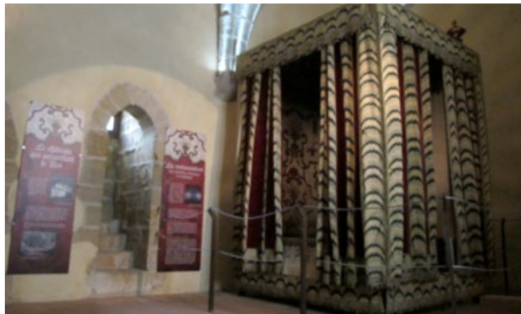
« Les univers du Roi Henri IV »